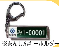
※あんしんキーホルダー