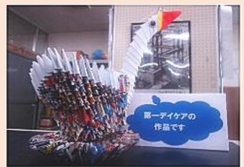
工作の作品(折り紙)