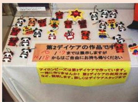
工作の作品(アイロンビーズ)