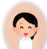
保健師または看護師