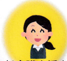
主任介護支援専門員 (主任ケアマネジャー)