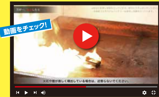
動画をチェック! 住宅火災におけるリチウムイオン電池火災月別発生状況(令和2年から令和6年までの5か年合計)

令和7年中の東京消防庁管内の住宅火災におけるリチウムイオン電池火災件数は過去最多の221件(速報値)発生し、平成29年の10倍以上になっています。特に夏場に向けて発生件数が増加する傾向にあります。出火防止のポイントを知り、リチウムイオン電池火災を防ぎましょう!